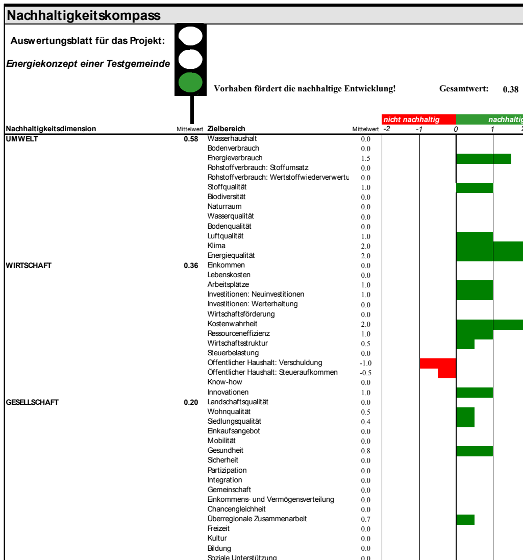
Abbildung 2: Beispiel zur Interpretation des Ergebnisses: Energiekonzept einer Testgemeinde